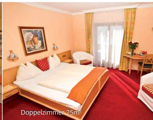
Doppelzimmer 25m 2