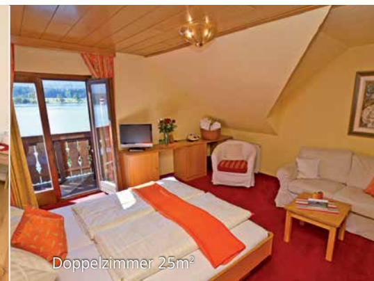
Doppelzimmer 25m 2