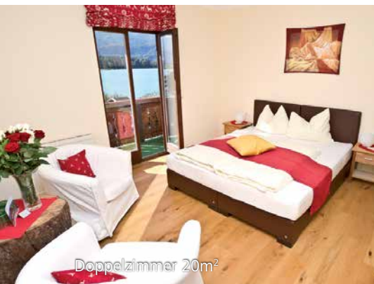
Doppelzimmer 20m 2