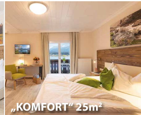
„KOMFORT“ 25m 2

„STANDARD“ DOPPELZIMMER BERGBLICK ca. 20m 2 – mit Balkon & Bergblick gemütliche Sitzgelegenheit, Safe, Flatscreen TV, Badezimmer mit Dusche, WC, Haarfön, Badetasche mit Badehandtuch