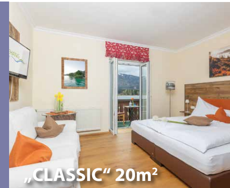
„CLASSIC“ 20m 2

„CLASSIC“ DOPPELZIMMER SEEBLICK ca. 20m 2 – mit Balkon & wunderschönem Seeblick gemütliche Sitzgelegenheit, Safe, Flatscreen TV, Badezimmer mit Dusche, WC, Haarfön, Badetasche mit Badehandtuch