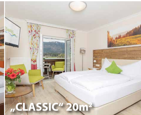
„CLASSIC“ 20m 2

„KOMFORT“ DOPPELZIMMER SEEBLICK ca. 25m 2 – mit Balkon & wunderschönem Seeblick gemütliches Sitzsofa, Safe, Flatscreen TV, Badezimmer mit Dusche, WC, Haarfön, Badetasche mit Badehandtuch